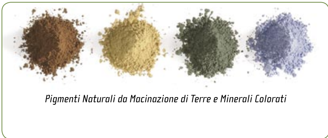
Pigmenti Naturali da Macinazione di Terre e Minerali Colorati