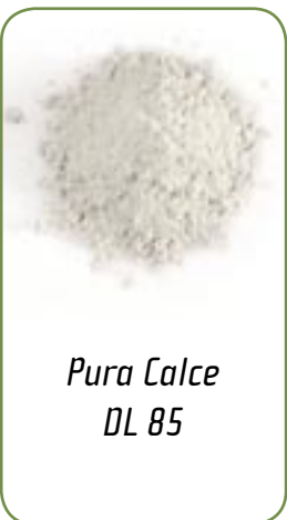
Pura Calce DL 85